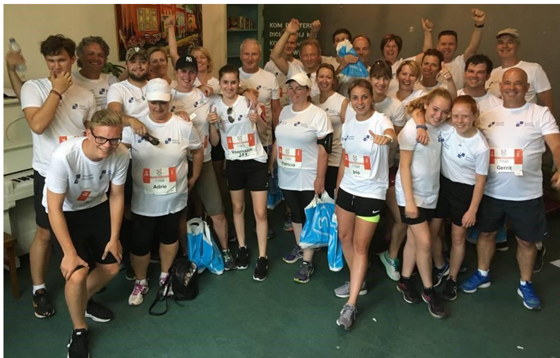
Een prachtig voorbeeld van actieve fondsenwerving: Succesvolle actie van TK Challenge tijdens de Leiden Marathon

De LUMC Vrienden Stichting wil samen met de medewerkers en de patiënten van het Willem-Alexander Kinderziekenhuis alle lopers bedanken die zich hebben ingezet. Hopelijk zijn jullie er volgend jaar weer bij!