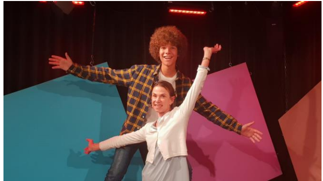
Kinderentertainment bij Studio KidzFlitz