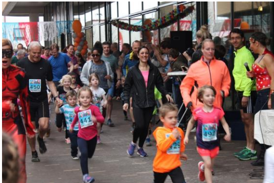
De Superhero Family Run in april 2018

Studio KidzFlitz is een project dat buiten het reguliere zorgbudget van het WAKZ valt. Daarom is het volledig afhankelijk van de giften van donateurs.